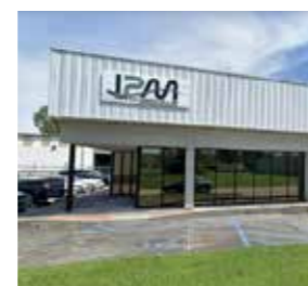
Industrial Plastics & Machine Inc. U.S.A.