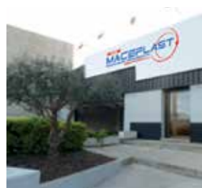
Maceplast España S.L. Spain