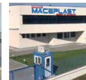
Maceplast Romania S.A. Romania