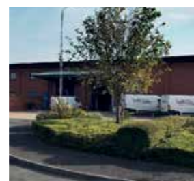
VAC Innovation LTD United Kingdom