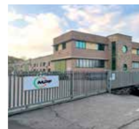
MPF s.r.l. Italy