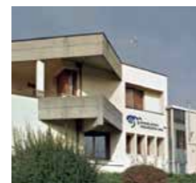
Ghirlandi Maurizio s.r.l. Italy