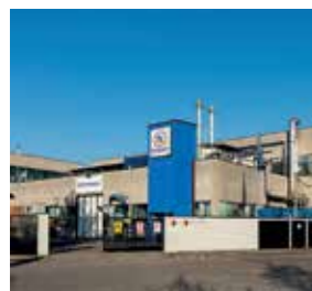
Flontech Division Italy