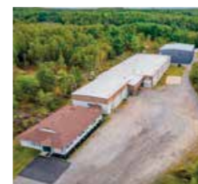
Industrial Plastics Inc. Canada