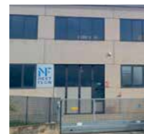
Nextflon s.r.l. Italy