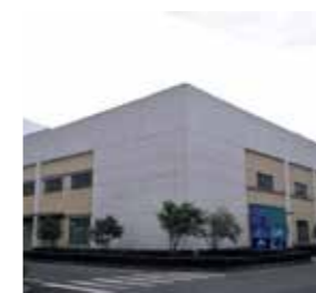
Zhejiang Green Guarniflon Film Technology CO., LTD. China