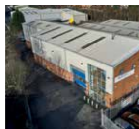
Maceplast U.K. LTD United Kingdom