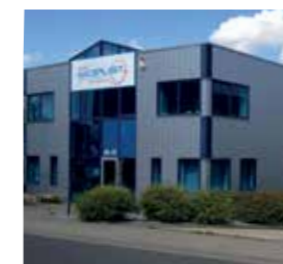
Maceplast GmbH Germany