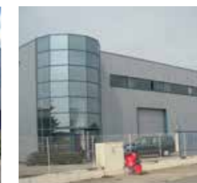
Maceplast S.A. France