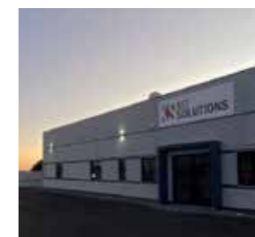
Kit Solutions s.r.l. Italy