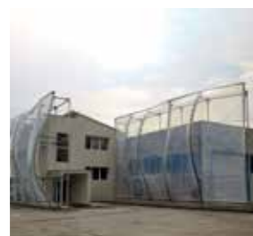
PATI Division Italy