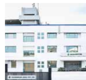
Guarniflon India PVT. LTD. India