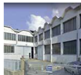
Ghivi s.r.l. Italy